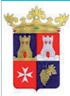
Ville de Binefar (Espagne)