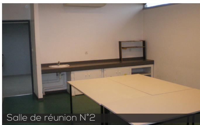
Salle de réunion N°2