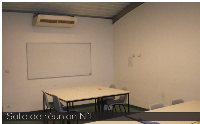
Salle de réunion N°1