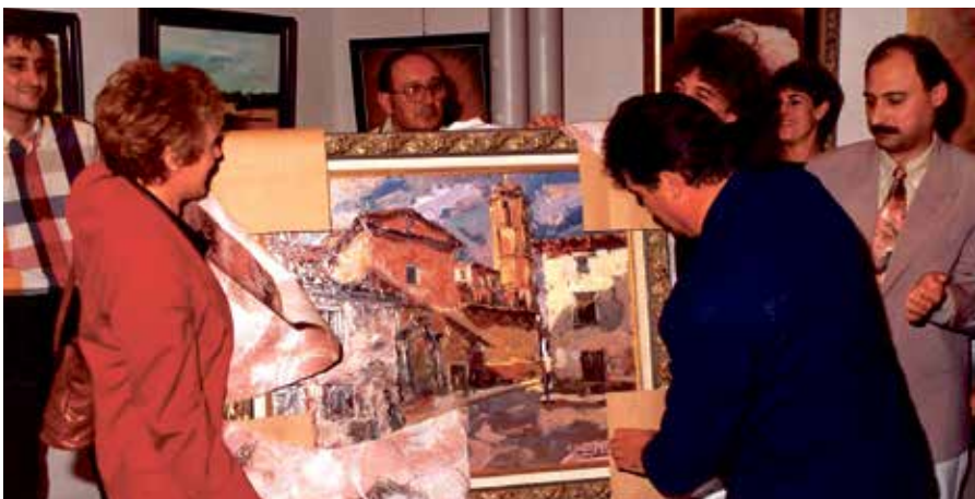
Exposición de pintores binefarenses en Portet.