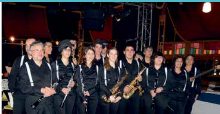
La Big Band en el Festival de la Méditerranée en Portet