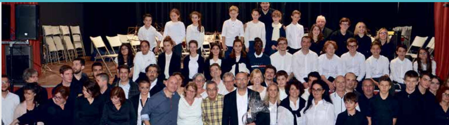
⌚ Miembros de las escuelas de música de Portet y Binéfar tras el concierto en Binéfar 77.