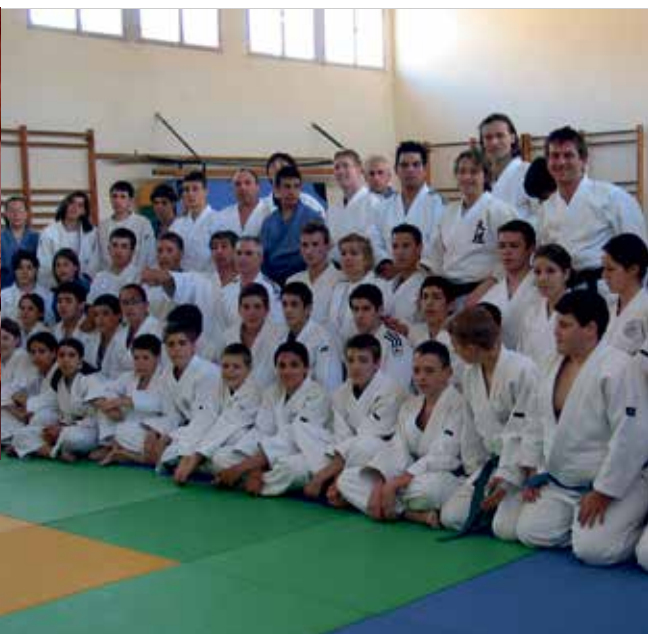
⌚ Los yudocas portesienses en su estancia en Binéfar.