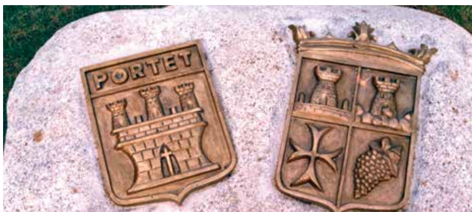
⌚ Hito conmemorativo, situado en la plaza de España de Binéfar.