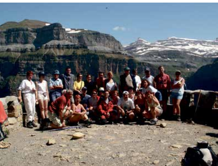
Montañeros binefarenses y portesienses.

En octubre de 1997, la tercera edad en Binéfar recibió a un grupo de jubilados de Portet, aprovechando la edición de Febivo y midiendo sus fuerzas en un animado torneo de petanca que culminaron con cena y baile.