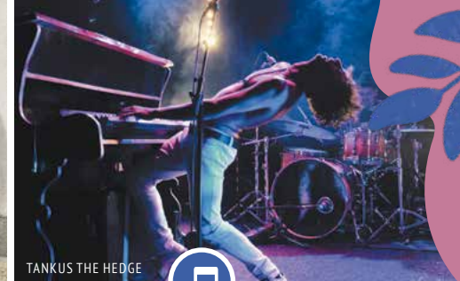
TANKUS THE HEDGE