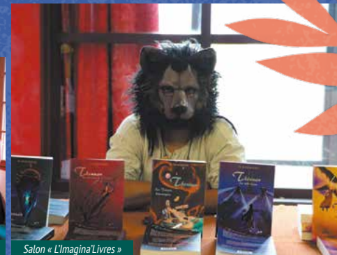
Salon « L'ImaginaLivres »