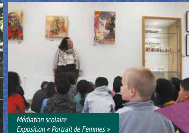
Médiation scolaire Exposition « Portrait de Femmes »