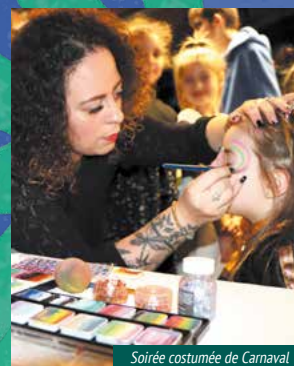
Soirée costumée de Carnaval