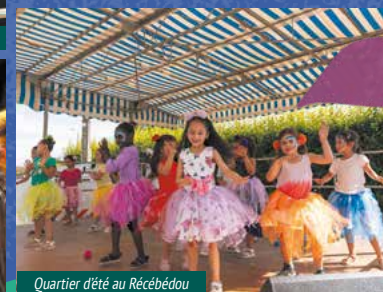
Quartier d'été au Récébédou