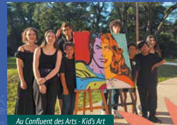
Au Confluent des Arts - Kid's Art