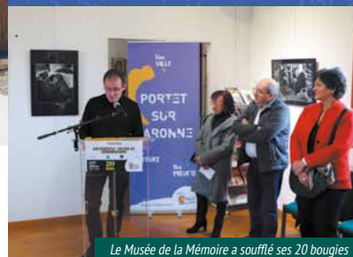
Le Musée de la Mémoire a soufflé ses 20 bougies