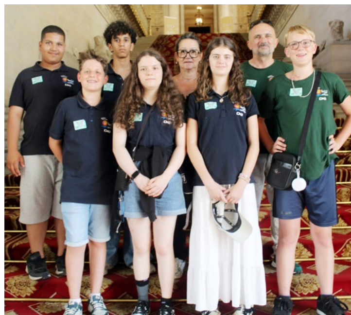
▲ En juillet 2025, les jeunes élus ont pu visiter et découvrir le Sénat au palais du Luxembourg à Paris.