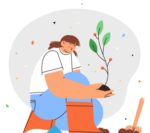
Participation aux plantations en ville

Comment postuler ? Formulaire de demande sur www.portetgaronne.fr ou à l'Espace Pierre de Coubertin. Renseignements : Tél : 05 61 41 40 80.