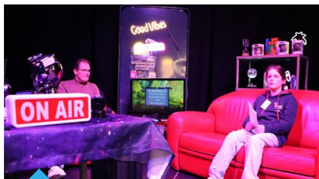
Implication active dans l'élaboration et l'animation de Connexion Jeunesses, le grand rendez-vous des jeunes qui se déroule depuis 2 ans au printemps

Autant d'actions qui montrent que les jeunes Portésiens ont des idées, de l'énergie et surtout, une vraie envie de faire bouger les choses.