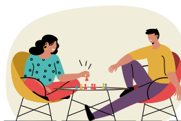
Développement de la ludothèque à la médiathèque François Peraldi